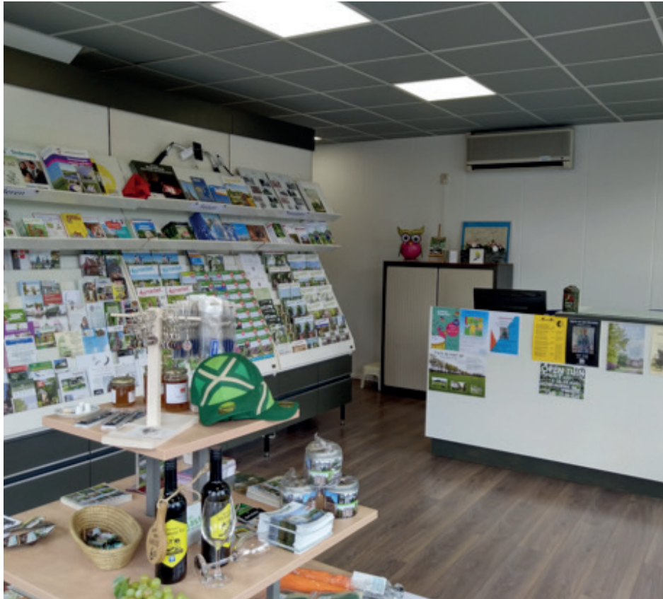
"Het toeristisch jaar 2019 was tot op heden een jaar vol nieuwe ontwikkelingen."